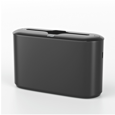
Tork Xpress H2 Disp Count. Asciug. nero 552208