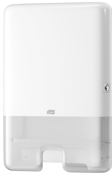
Tork Xpress H2 Disp Asciugamani bianco 552000