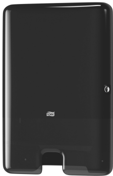
Tork Xpress H2 Disp Asciugamani nero 552008