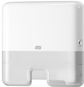
Tork Xpress H2 Disp Mini Asciug. bianco 552100